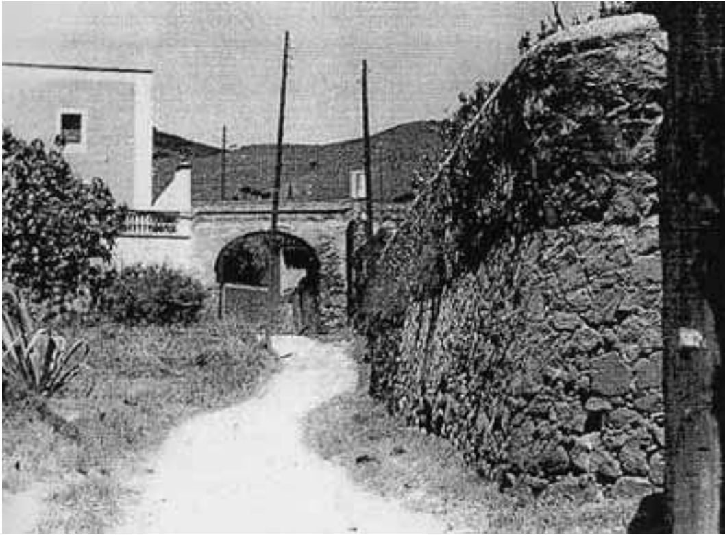
Can Brassó, camí de Sant Ciprià

Sist era un gos de gran vitalitat, esquerp i reganyós amb els forans i manyac i submís amb els de casa. Era un ca més aviat corpulent, sense sobrepassar a gran altura, pelatge d'un blanc torrat amb taques al cap color canyella. De cua curta com escapçada, nas negre un xic arrodonit, bigotis llarg que li mig tapaven la boca, orelles caigudes com pàmpols assedegats, ulls grisos de mirada trista cercant manyagueries. Malgrat l'aparença dòcil i juganera, procedia de bona nissaga caçadora per el bon gaudir del pare.