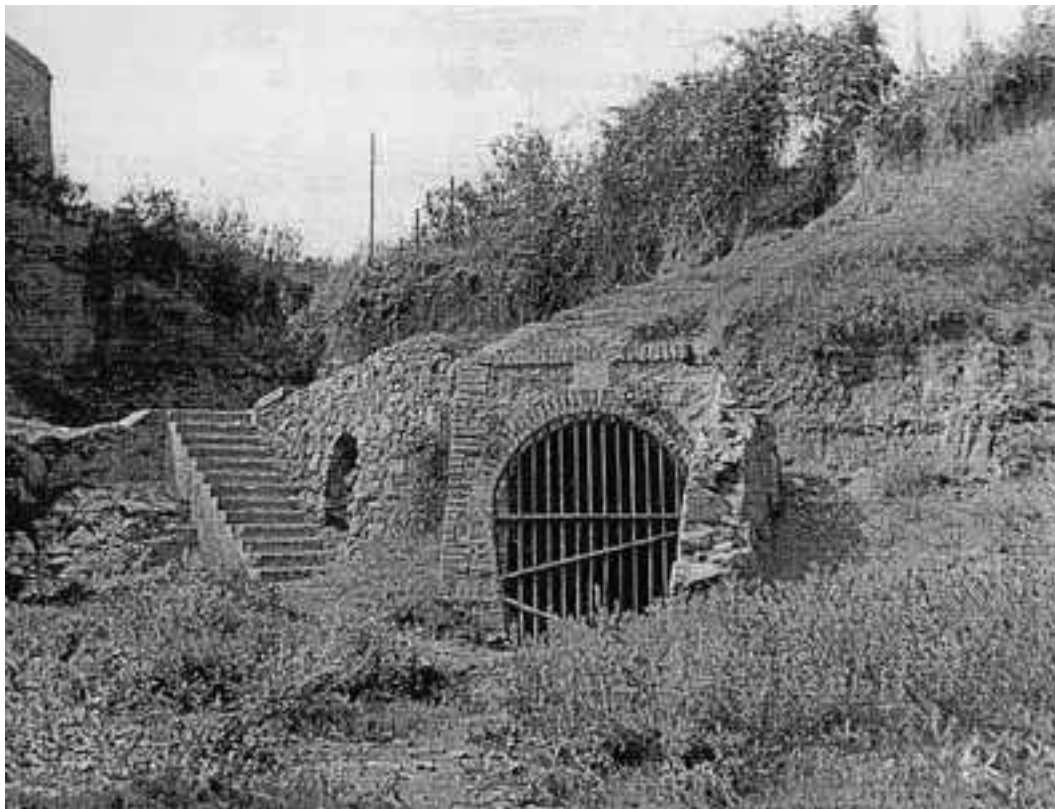
...la mina de Can Marcel·lí "La font d'en Marcelino"

Quan jo tot seguit el cridava acudia tot romancejant al meu costat i amb aquella mirada llastimosa que sabia posar s'ajeia als meus peus com pecador penedit.