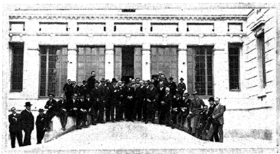
Grupo de Arquitectos visitantes